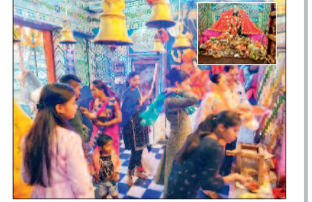
हरिभूमि न्यूज ▶▶ नवापारा-राजिम

शहर में पंचमी के पावन अवसर पर देवी भक्ति का अद्भुत नजारा देखने को मिला। सुबह से ही शहर के सभी देवी मंदिरों में श्रद्धालुओं की भीड़ उमड़ पड़ी, जहाँ भक्ति और श्रद्धा के साथ विधि-विधान से पूजा-अर्चना की गई। इस दौरान महिलाओं और पुरुषों ने पूरे उत्साह के साथ मां का श्रृंगार कर पूजन किया और मंगलकामनाएं मांगीं। विशेष रूप से मां काली मंदिर में श्रद्धालुओं का ताता दिन भर लगा रहा। मंदिर परिसर में सुबह से ही भक्त चुनरी, नारियल, अगरबत्ती और भोग सामग्री लेकर पहुंचते रहे। मां के जयकारों और मंत्रोच्चारण से पूरा वातावरण भक्तिमय हो गया। श्रद्धालुओं ने मां के चरणों में अपनी आस्था अर्पित कर परिवार की सुख-समृद्धि और खुशहाली की कामना की। पंचमी के अवसर पर देवी मां का विशेष श्रृंगार भी आकर्षण का केंद्र रहा। फूलों, चुनरी और विभिन्न श्रृंगार सामग्रियों से सुसज्जित मां की प्रतिमा के दर्शन के लिए भक्तों की लंबी कतारें लगी रहीं। महिलाएं मंदिर पहुंचकर पूजा-अर्चना की और धार्मिक अनुष्ठानों में भाग लिया। देर शाम आयोजित महाआरती में भी बड़ी संख्या में श्रद्धालु शामिल हुए। खासकर महिलाओं की सहभागिता उल्लेखनीय रही, जिन्होंने भक्ति गीतों और जयकारों के साथ पूरे माहौल को भक्तिमय बना दिया। आरती के दौरान मंदिर परिसर में श्रद्धा और उत्साह का अनूठा संगम देखने को मिला। पंचमी के इस पावन अवसर पर शहर पूरी तरह भक्ति में डूबा नजर आया। मंदिरों में उमड़ी भीड़ और श्रद्धालुओं की आस्था ने यह साबित कर दिया कि नवरात्रि का पर्व लोगों के जीवन में विशेष महत्व रखता है और यह आस्था, विश्वास और सामाजिक एकता का प्रतीक है।